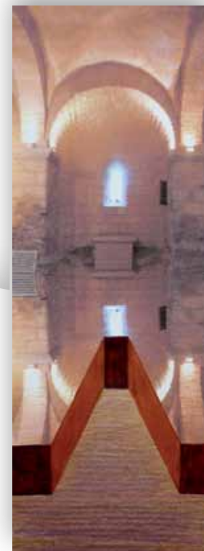
« Passage », projet Zsuzsa Farkas

sam. 19 > 14 h à 20 h 14 bis rue de Seine [Centre-Ville]