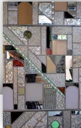
« La Cité », détail Serge Elphège

Réservation indispensable au 01 34 23 58 76