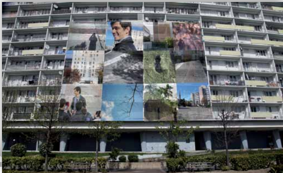
« Regards croisés » à la cité Champagne, montage Klaus Fruchtnis